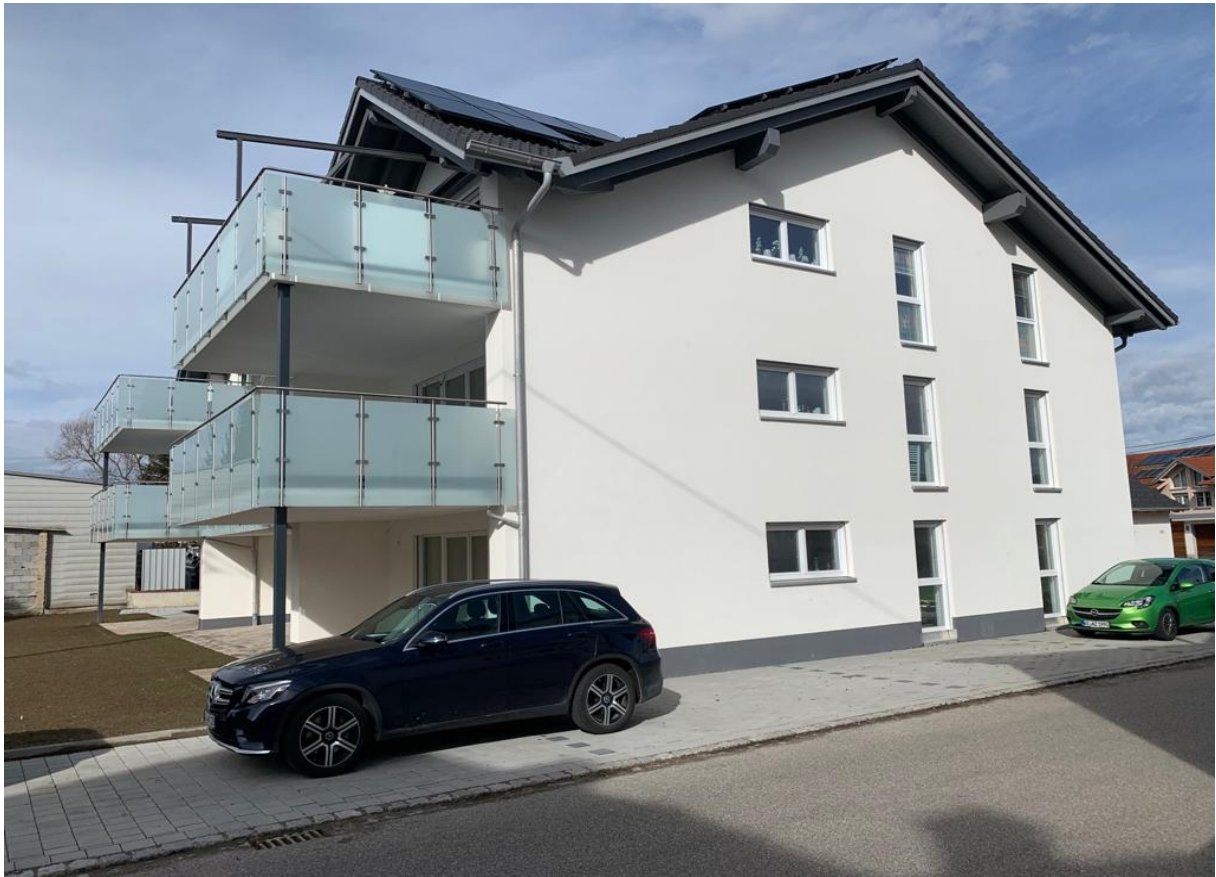
Ostansicht vom Wohnhaus mit insgesamt 9 Wohnungen